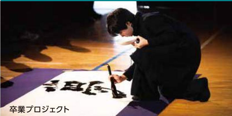
卒業プロジェクト

説明だけではわからない高等部の学び。 そこで中学生のみなさんを対象とした体験授業を開催いたします。 高等部への転入をお考えの方はぜひご参加ください。