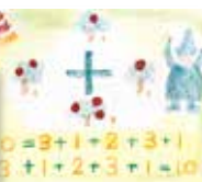
エポックノート (フォルメン、算数)