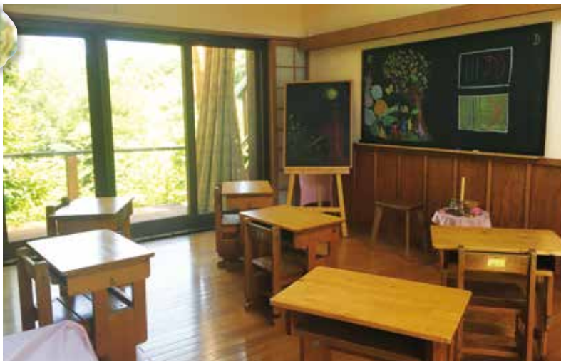
風光山荘の教室風景