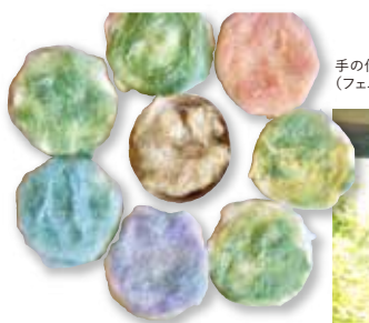
手の仕事 (フェルト作り)