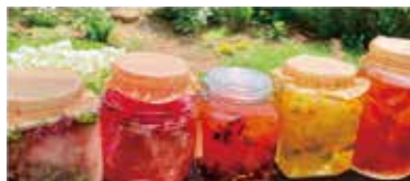
手の仕事(羊毛のお日さま染め)